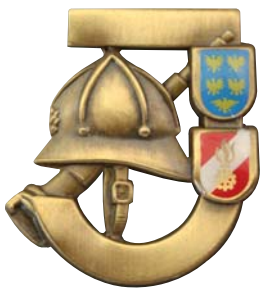
Die Feuerwehrjugend bei den Landesbewerben in St. Pölten: Gruppe Bronze