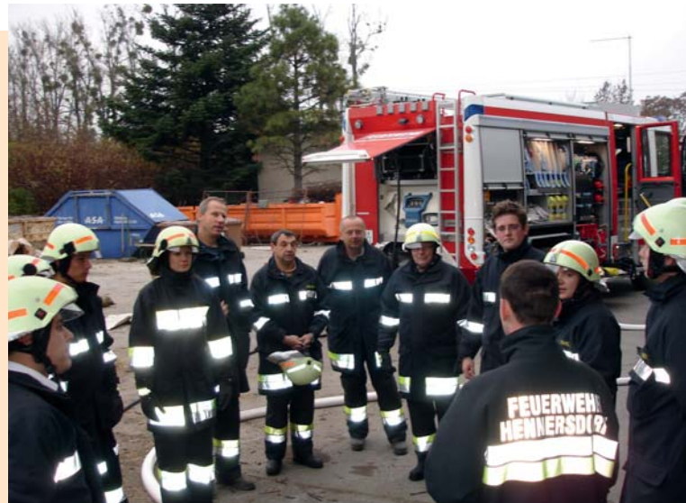
Impressionen aus dem