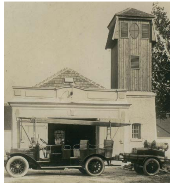
Unser Feuerwehrhaus um 1925/30 und im Jahr 2011

Seit Herbst 2011 wird nun eine Adaptierung bzw. Erweiterung des Feuerwehrhauses am bestehenden Standort aus verschiedenen Gründen nicht mehr forciert. Die Gemeinde hat im Gegenzug einen Neubau an einem anderen Standort in Aussicht gestellt und führt daher aktuell Gespräche mit den Besitzern von in Frage kommenden Grundstücken.