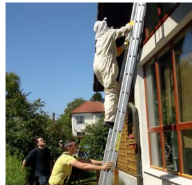
TE 03.09.2011: Wespennestentfernung