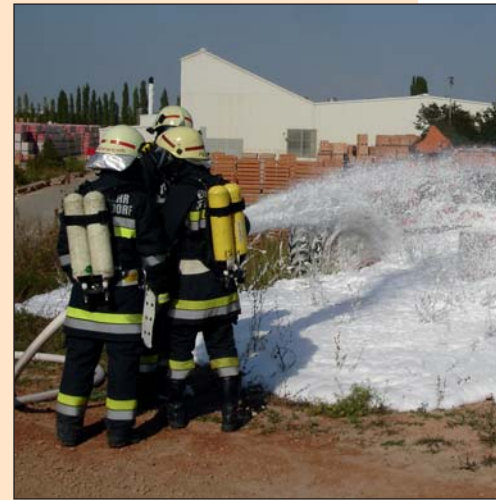
Ausbildungsbetrieb im Jahr 2011