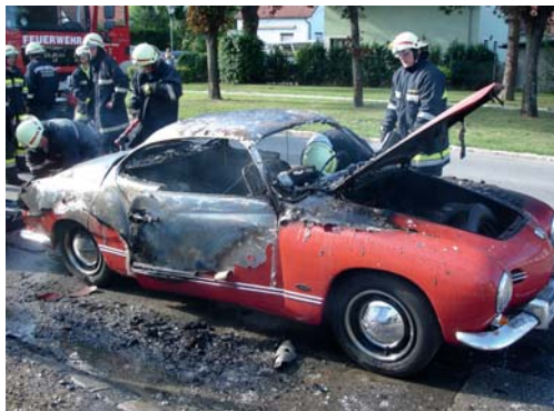
BE 21.06.2011: PKW-Brand