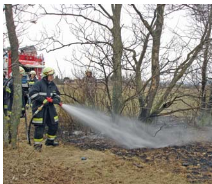
BE 13.03.2011: Flurbrand

Weiters hatten wir 2011 37 Brandsicherheitswachen (BSW), mit insgesamt 74 Mann und ca. 228 Einsatzstunden zu leisten.